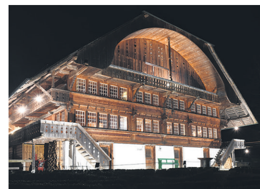
Landgasthof Rohrmoos in der frühen Morgenstunde